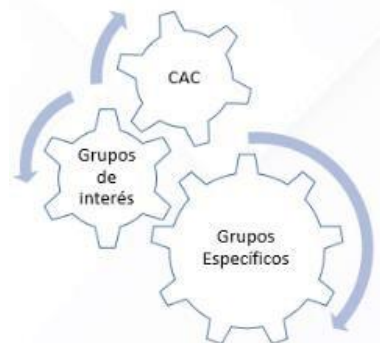
Gráfico No.3: ¿Quiénes interactúan?