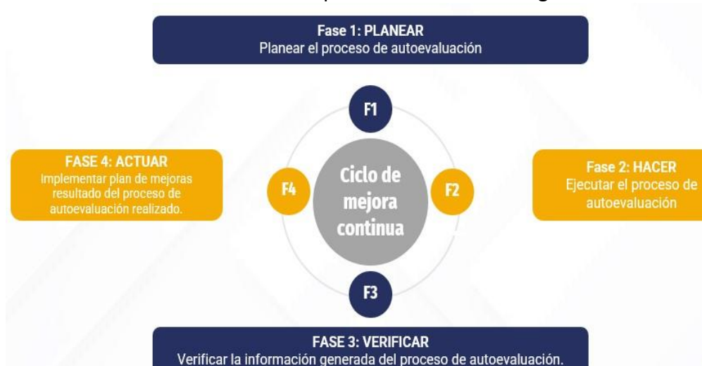
Gráfico No.2: Adaptación del ciclo Deming

Fuente: Guía referencial para implementación de procesos de autoevaluación