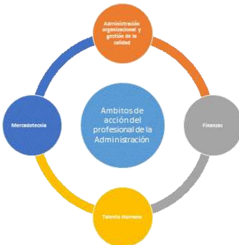
Gráfico 2 Ejemplo de Ámbitos de acción del profesional de la administración

El profesional de la Administración, por ejemplo, podría desempeñarse profesionalmente en cualquiera de los siguientes ámbitos: Administración organizacional y gestión de la calidad, Finanzas, Mercadotecnia y Talento Humano.