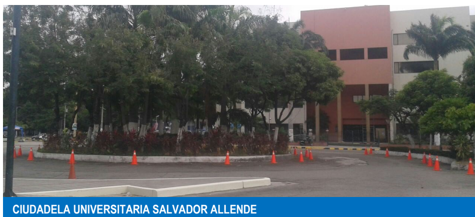
CIUDADELA UNIVERSITARIA SALVADOR ALLENDE

“En la actualidad se tiene un déficit de espacios para sitios de tiempo completo, medio tiempo y tiempo parcial para docentes, así como la cantidad necesaria de puestos de lectura según la cantidad de estudiantes.”